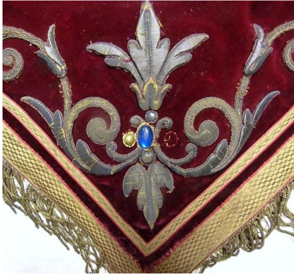
Detail: onder punt voor behandeling.