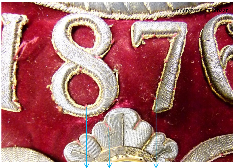
Grote naaisteek waarmee het stulpborduurwerk is vastgenaaid.