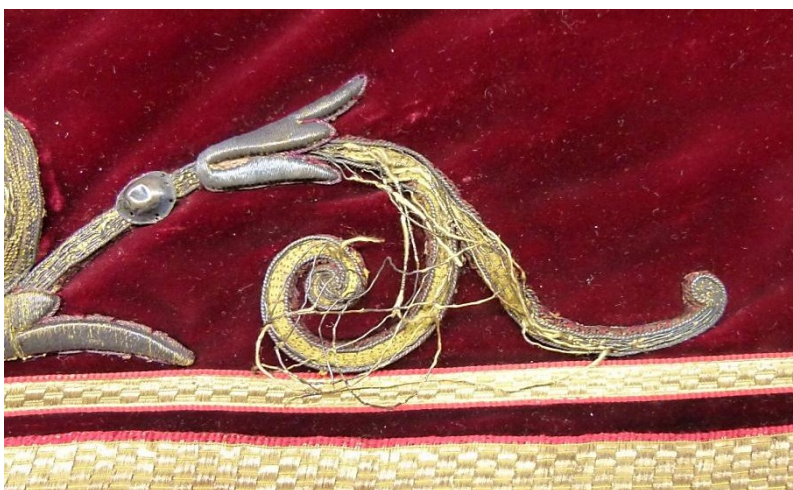
Detail: losse metaaldraden, voor behandeling.