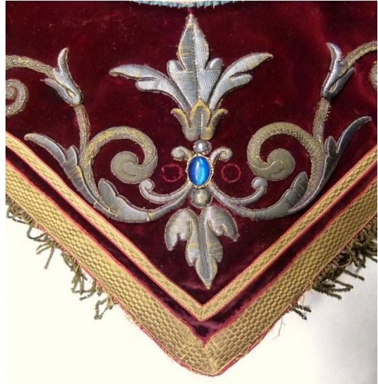
Detail: onder punt na behandeling.