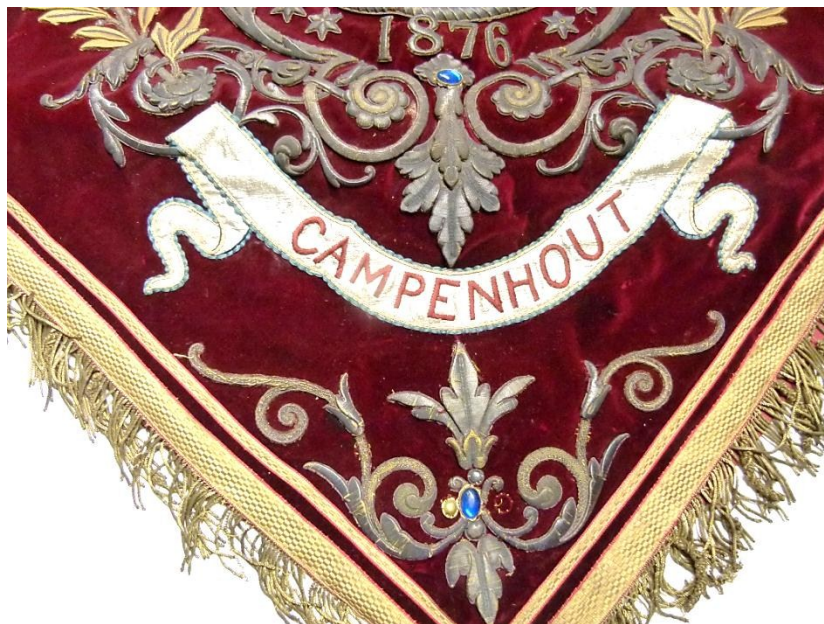
Detail: vernieuwde tekstrol ‘Campenhout’.