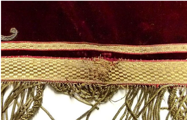
Detail beschadigd galon: voor behandeling.