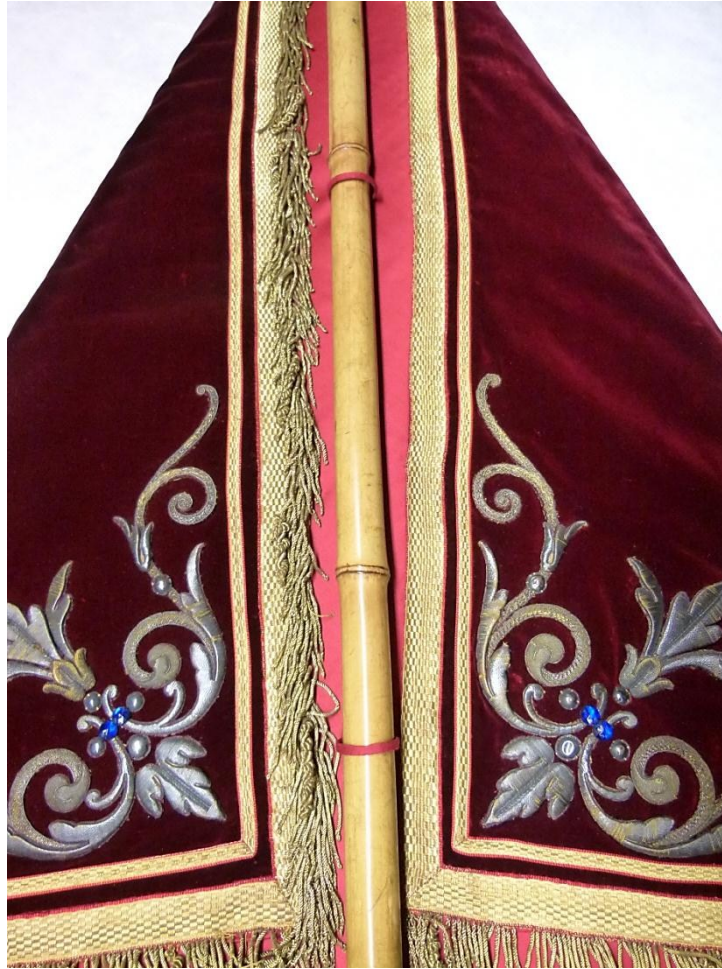
Detail achterzijde: draagstok die door de lussen gaat.