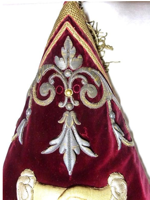
Detail: boven punt na behandeling.