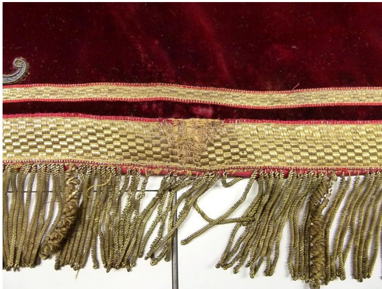
Detail beschadigd galon: na behandeling.