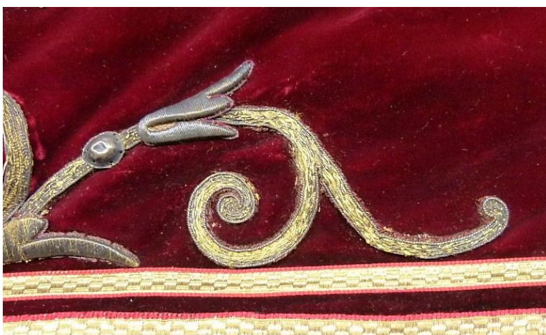
Detail: na behandeling.