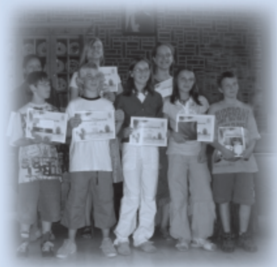
Proficiat aan dit jong schrijverstalent!

Deze laureaten van de poëziewedstrijd cultuurraad Kampenhout gingen automatisch mee aan de prestigieuze internationale Soetendaellowedstrijd voor jeugdpoëzie te Merchtem. De laureaten kregen elk een boekenwaardebon. Met de uiteindelijke keuze laten we jullie graag hieronder kennismaken: