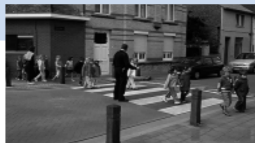
Kleuters kennen de gevaren van het verkeer niet; daarom toont de lokale politie hen hoe het veilig kan.