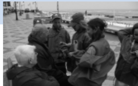
Leren is niet alleen op de schoolbanken zitten, met je neus in de boeken of naar het bord gericht. De leerlingen van de 3 de en 4 de leerjaren trokken op zeelessen naar De Haan en leerden heel wat over de kust, de vissen, de duinen en zeevaart, ...