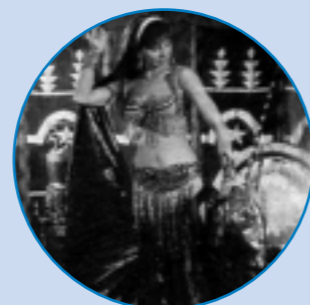
Zembra, de wonderlijke buikdanseres die je meeneemt naar het sprookje van 1001-nacht

Indien u vervoerproblemen heeft, meldt dit dan bij uw inschrijving! Wij zoeken hiervoor een oplossing.