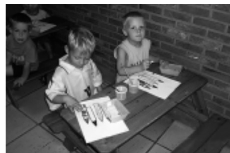
Plakken: 1 ste kleuterklas Berg