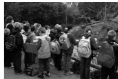
Zoo: Nederokkerzeel klas 3 en 4

In de gemeentescholen Het Klimtouw en De Toverberg wordt niet alleen geleerd binnen de klasmuren maar gaan de leerlingen soms eens naar buiten waar ook heel wat kan geleerd worden.