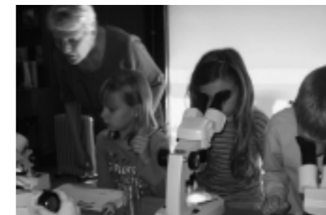
Kriebelbeestjes onderzoeken: Berg klas 3