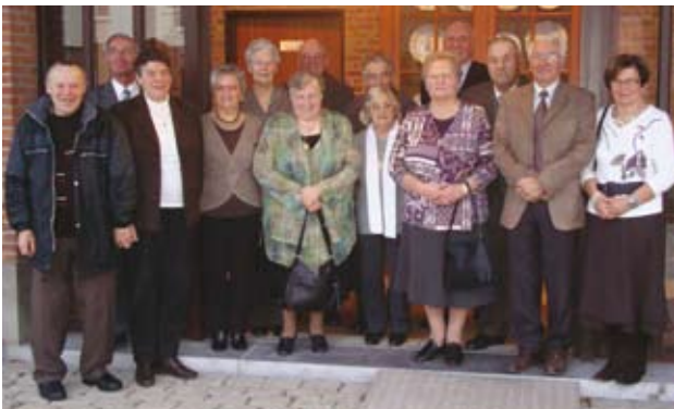
Ontvangst gemeentehuis op 21 november 2008.