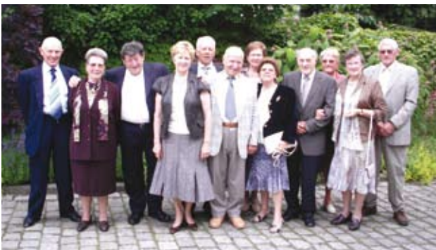
Een sfeerfoto van diegenen die in de eerste helft van 2008 hun gouden bruiloft vierden willen we u ook niet onthouden. Zij waren onze gasten op 20 juni 2008.

*Nabestaanden dienen uitdrukkelijk toestemming te verlenen om deze gegevens te publiceren. Indien uw dierbare niet in Kampenhout zelf overleden is, zendt de dienst burgerlijke stand van de overlijdensplaats (bvb Leuven) een officiële kennisgeving naar de woonplaats (Kampenhout). Het is pas na ontvangst van dit bericht én overschrijving van de overlijdensakte in onze registers van de burgerlijke stand dat samen met de uittreksels het toestemmingsformulier voor de gemeenteberichten wordt verstuurd. Het is dus mogelijk dat uw toestemmingsformulier voor publicatie nog niet in ons bezit is op het moment dat de gemeenteberichten worden opgemaakt. Deze gegevens worden dan automatisch in de volgende editie opgenomen. Dank voor uw begrip.