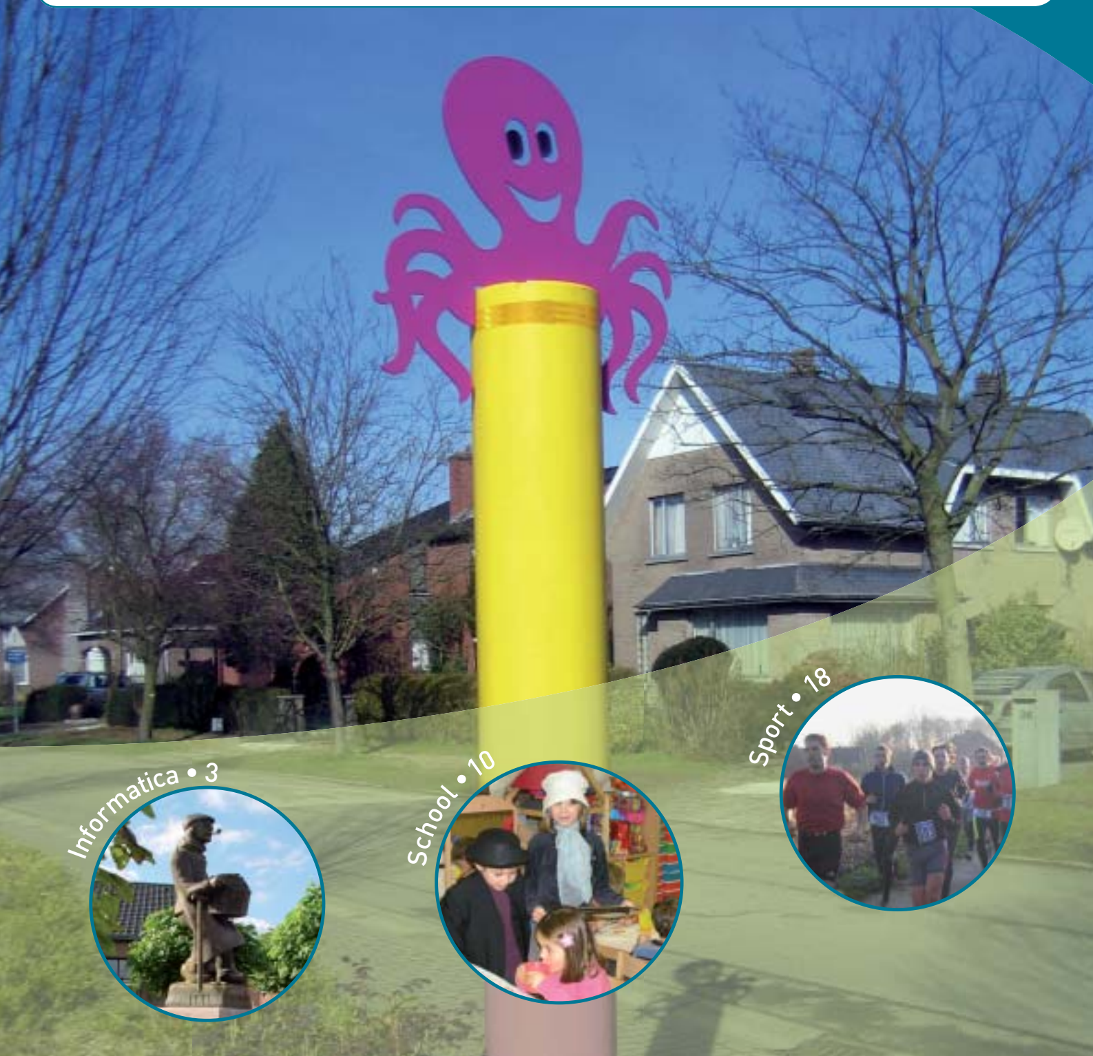
Informatica • 3