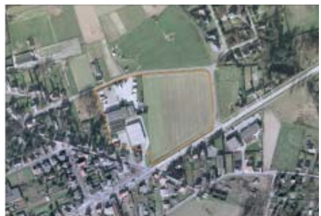
Luchtfoto Kampenhout schaal 1/2.000

Bij de ontwikkeling van het bedrijventerrein dient voldoende rekening gehouden te worden met de aanpalende woongebieden. De opmaak van dit plan voorziet in het herlokaliseren van zonevreemde bedrijven.