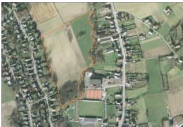
Luchtfoto project Sporthal Kampenhout schaal 1/2.000

De gemeente Kampenhout is eigenaar van de terreinen achter de sporthal (achter de Weesbeek). Het is de bedoeling om volgens het Gemeentelijk Ruimtelijk Structuurplan deze percelen te herbestemmen.