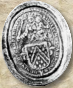
Zegel van de familie de Fourneau de Cruycknburg