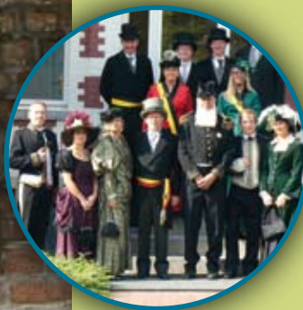
Gemeente • 3