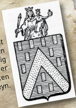
Afbeeldingen uit het Geschied- en Aardrijkskundig woordenboek der Belgische Gemeenten door Eug. De Seyn.