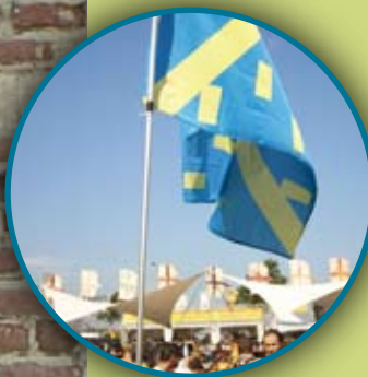
Welzijn • 10