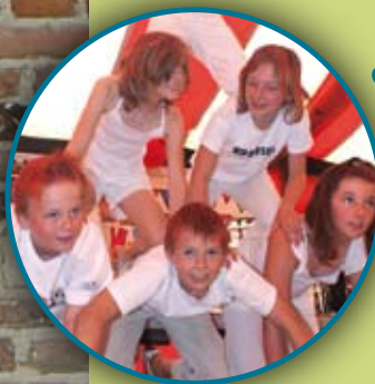
Onderwijs • 18