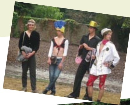
Veel groetjes van de animatoren en de jeugddienst.

Volgend jaar staan we weer allemaal klaar voor een spetterende zomer op het Grobbeltje, hopelijk ben jij er dan ook weer bij!