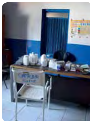
Alle beetjes helpen

Voor de bouw van deze kraamkamers is een bedrag van 50 000 euro nodig, Gamrupa beschikt jammer genoeg niet over voldoende budget en is daarom doorlopend op zoek naar giften en sponsors. Wie ons graag wil helpen, alle hulp is welkom en ook kleine bedragen maken samen een groot!