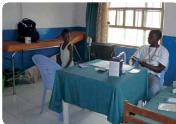
Even rust tussen 2 verzorgingen

Gamrupa The Gambia kreeg van de VDC (Village development committee) het verzoek om kraamkamers te bouwen aan de door hen onlangs gerenoveerde medische post in Sifoe, terwijl elders met spoed vroedvrouwen en kraamverzorgsters worden opgeleid.