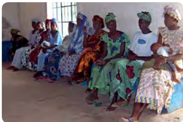
Moeders met kind wachten op hun beurt

Vroeger was thuis bevallen een normale zaak voor de bevolking van Gambia. Dit gebeurde op de grond of op een bed in een stoffige slaapkamer. Een ervaren vrouw stond de jonge moeder wel terzijde, maar voor bijzondere gevallen moest de vrouw toch naar het ziekenhuis. Daar was de hygiëne doorgaans niet veel beter, maar was wel een gediplomeerde vroedvrouw aanwezig.