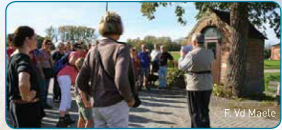
F. Vd Maele

Toeristische dienst (016 65 99 71 of toerisme@kampenhout.be)