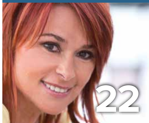
Seniorenfeest 22 september