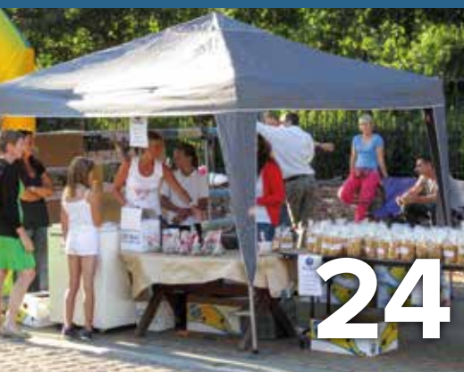
Avondmarkt en kermis