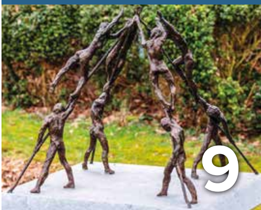
Wint Kampenhout Kunst op komst?