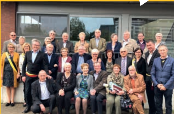
Ontvangst gouden jubilarissen