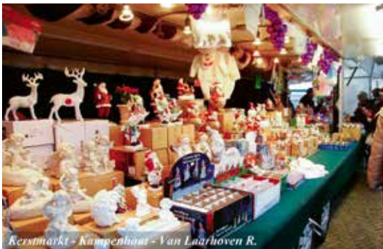
Kerstmarkt - Kampenhout - Van Laarhoven R.

Geef ons secretariaat een seintje via secretariaat@kampenhout.be of 016/65 99 22 (voor 20 september).