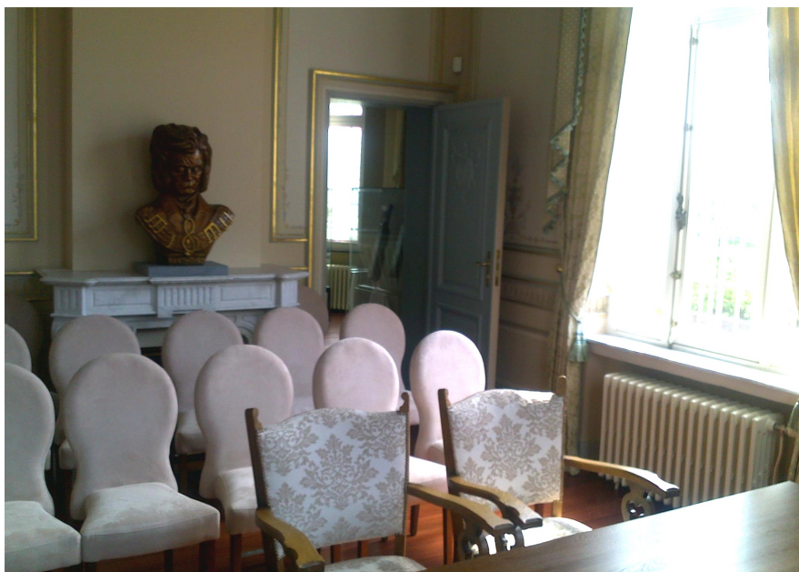
Foto's met zicht op de trouwzaal anno 2012. Achteraan staat een buste van componist Ludwig van Beethoven.

In de kelderlokalen, vroeger de ruimtes voor het dienstpersoneel, bevinden zich een goed uitgeruste keuken, het lokaal van heemkring Campenholt ( www.kampenhout.be/ heemkring), toiletten en diverse opberglokalen. Op de eerste verdieping bevinden zich de kantoorruimtes van het gemeentelijk personeel, alsook op de tweede verdieping en één op het gelijkvloers (diensten cultuur, welzijn & communicatie, IT). Onder de zolderruimtes, ook op het tweede niveau bevindt zich een polyvalent vergaderlokaaltje.