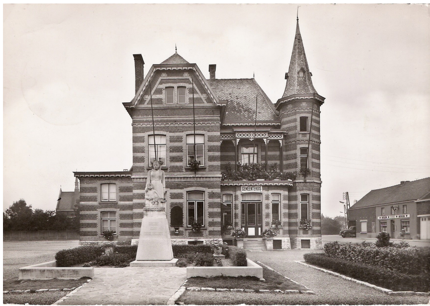
Villa Lucie als gemeentehuis. Let ook op de voormalige kapel van het rusthuis, links op de foto, waar nu een polyvalente ontmoetingszaal (Glazen Zaal) gezet is (JMV).

Aangezien de serre (westelijke kant) zich in een zeer bouwvallige staat bevond, werd deze rond 1980 afgebroken, zodoende dat rotspartij en trap weer en wind moesten doorstaan. Jarenlang heeft zich naast de trap een goed florerende frituurcaravan bevonden.