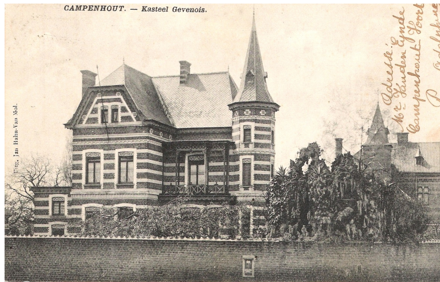
Villa Lucie eind 19 de - begin 20 ste eeuw (JMV)

De immense tuin met (linde)bomen en planten, de serre die dienst deed als wintertuin en de kunstmatige grot aan de voorzijde waren kenmerkend voor de tijdsgeest in de tweede helft van de 19 de eeuw. De hoge strenge muren maakten dat de bewoners van Villa Lucie in een eigen groene wereld vertoefden.