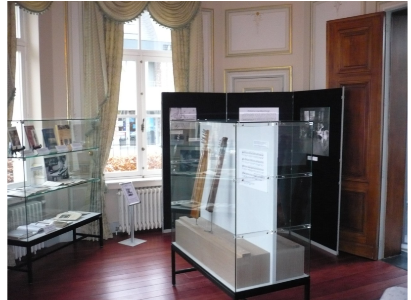
Zicht op de tentoonstelling "Hommel, volksinstrument voor de huiskamer" (december 2011-januari 2012).