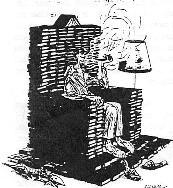
De miskende debutant was trots op zijn onverkochte boeken.