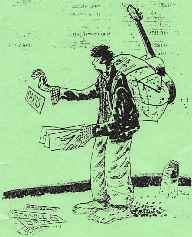
Dylans eerste roeping tot wereldtoernee.