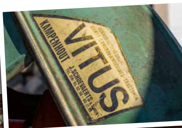
De iconische gele Vitus-sticker

Dit artikel kwam tot stand met de medewerking van heemkring Campenholt.