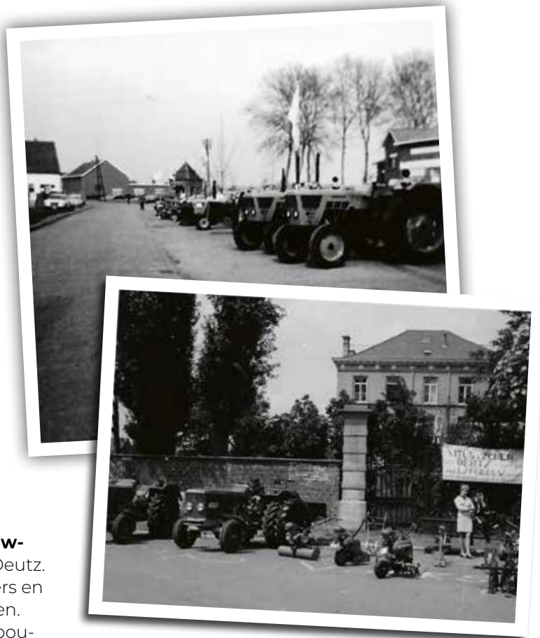
Vitus op de handelsfoor in Ruisbeek (boven) en op de Kampenhoutse jaarmarkt (onder)

Vitus verrichtte toonaangevend werk , zij het vaak op een heel eigen manier. Zo was het bijvoorbeeld niet uitzonderlijk dat onderdelen van de ene binnen-gebrachte tractor voor de herstelling van de andere gebruikt werden. De firma deed gouden zaken, maar haar toekomst begon er gaandeweg steeds minder goudkleurig uit te zien. Langzaam maar verminderde het aantal witlooftelers in het algemeen en door de opkomst van de hydrocultuur slonk ook het aantal traditionele witlooftelers. Dat in