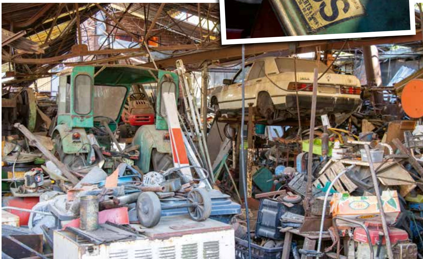
Een blik op de verloederde, volgestouwde loods